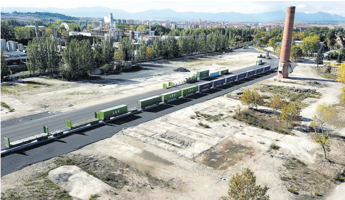
Miranda es un importante nudo logístico con conexión ferroviaria con varios puertos marítimos. / DB