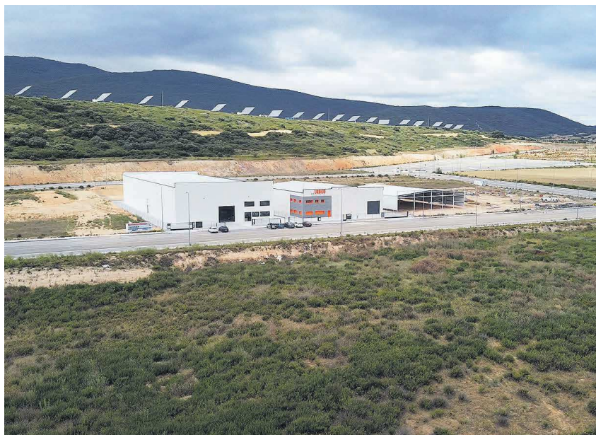
Varias empresas se están implantando en la ciudad.

Sin embargo, esta evolución tan positiva se ha visto repercutida por la pandemia, dado que, según datos del SEPE, en sólo 3 meses (mar-